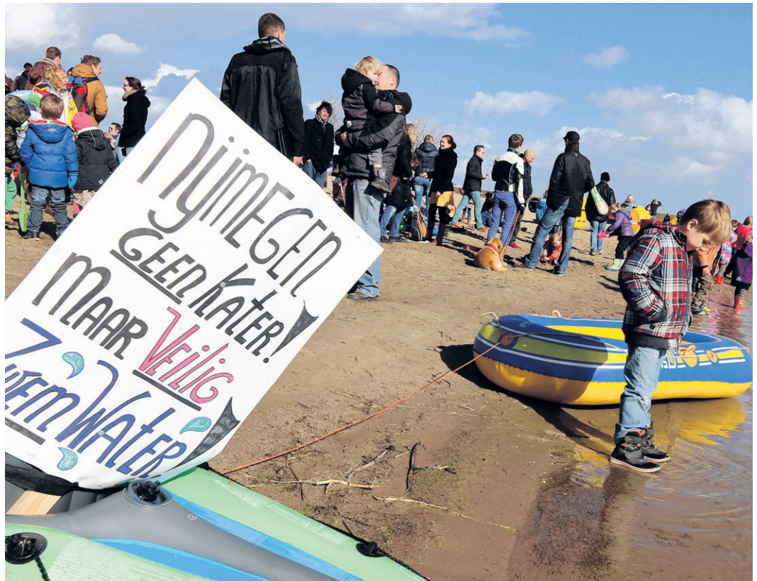
◀ Buurtbewoners demonstreerden eerder tegen de slibstort.

Roelofs vindt het wel essentieel dat op het slib een afdeklaag van zeker twee meter komt. De gemeente Nijmegen gaat uit van een halve meter. De expert vindt ook dat de plassen van elkaar gescheiden moeten blijven: dus geen verbinding. Hij ziet graag dat Nijmegen ook nog eens goed onderzoekt hoe de ondergrondse Waalstromen lopen. Hij wijst erop dat het Waalwater veel sulfaat bevat. „Als dit in aanraking komt met ijzer, dan zal uiteindelijk fosfor vrijkomen uit het slib en dan krijg je vroeg of laat blauwalg.”